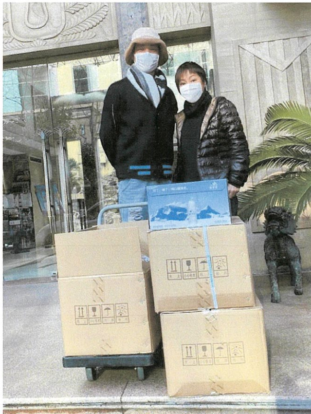
5000只口罩, 装了好几个纸板箱, 满载着一位中国母亲的感激情怀, 搭乘飞机, 带到了日本。这些口罩, 被送到了日语学校、送到了新浪微博日本分社, 也送到了我们亚洲通讯社。