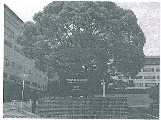
三和酒類は、大分県山間部の山紫水明の谷間にあった。

4人しかおらず、しかも全て女性である。ポトリングから異物安全検査へ、そして包装までは、完全な機械化生産である。しかし、逆に醸造工程すべてが100%の手作業である。会社には、12人からなる利き酒部隊があつて、彼らは「焼酎警察」と呼ばれ、各人全てが国の利き酒師の資格を持っており、長きに渡っての利き酒経験者で、社長自身もその一人である。焼酎の醸造蒸溜が終了し、ポトリングして製品になる前、12人が一緒に利き酒を行う。先ず原酒を味わい、次に調整後の製品を味わって、酒質と味わいが、最高基準に合致しているかどうか、ポトリングして出荷してもよいかどうか、全てが彼らの味覚の判断に